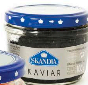
02475 Sucedáneo de Caviar Negro Tarro - 100 g