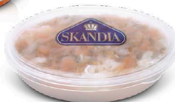
80601 Ensalada de Ahumados 650 g