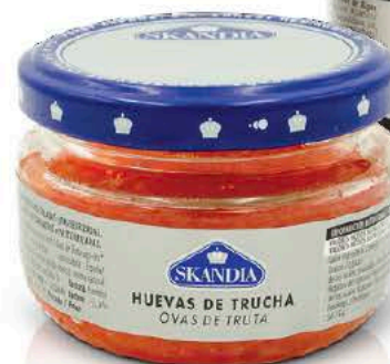
02422 Huevas de Trucha Tarro - 100 g