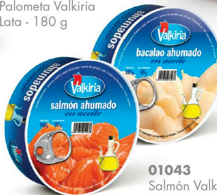
03343 Bacalao Valkiria Lata - 180 g