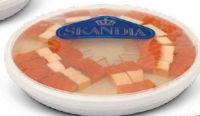
01069 Banderillas de Salmón con Queso - 370 g