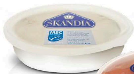
01044 Salmón Noruego Tarrina - 650 g